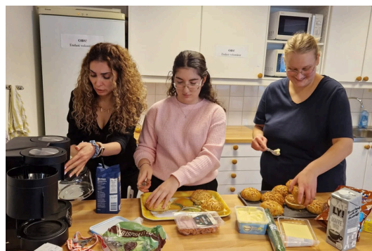
Fika är ett måste på volontärträffarna!

Vi har haft 5 volontärträffar under året där vi har haft föreläsningar, workshops, fikat, umgåtts och pärlat armband till våra loppisar. Året avslutades med vårt traditionella julfika där volontärerna fick julklappar som tack för deras fantastiska insatser under året. Volontärträffarna har varit mycket uppskattade av volontärerna.