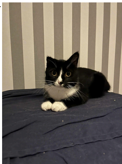
Asta i sitt jourhem

Under 2025 har 32 katter i föreningen bott i jourhem.