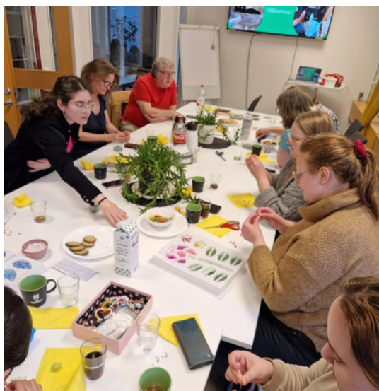
Armbandspärbling på volontärträff

Under 2025 introducerade vi ca 15 nya volontärer till föreningen, vilket är nästan dubbelt så många som tidigare år. Att ha så många volontärer har gjort det möjligt för volontärerna att övergå från att ha 2 tillsynspass i veckan till att bara ha 1 tillsynspass i veckan.