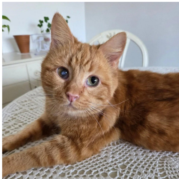
Toffee i sitt för-alltid hem

Efter ett första urval tar vi kontakt med den sökande för en telefonintervju och bokning av hembesök som antingen sker på plats eller digitalt. Anledningen till hembesöken är för att vi ska se till att katten hamnar i en miljö som känns passande för den men också för att kontakten mellan föreningen och den eventuella adoptören ska kännas mer personlig och inge ett förtroende.