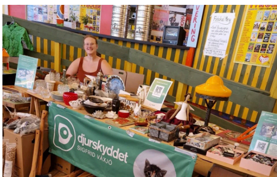
Loppisbordet uppdukat på Tyrolens jätteloppis

Genom dessa har vi under året dragit in nästan 20.000 kr. Detta tack vare alla privatpersoner som skänker grejer till loppisarna och köper lotter!